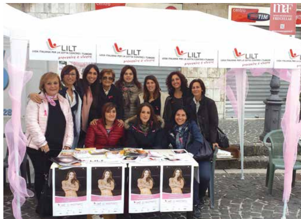
In piazza per distribuire materiale informativo

Infine, sono stati approvati diversi progetti, tra cui il Progetto del Servizio Civile Nazionale per l'inserimento di giovani volontari; il Progetto approvato dal Ministero del Lavoro e delle Politiche Sociali "Salute Senza Confini" con l'obiettivo di facilitare l'accesso alle cure mediche degli adolescenti e dei giovani adulti malati di tumore; il Progetto dalla Chiesa Valdese "Cittadini Del Mondo" con lo scopo di attuare campagne informative ed educative alla prevenzione delle malattie oncologiche attraverso il coinvolgimento dei medici di famiglia.