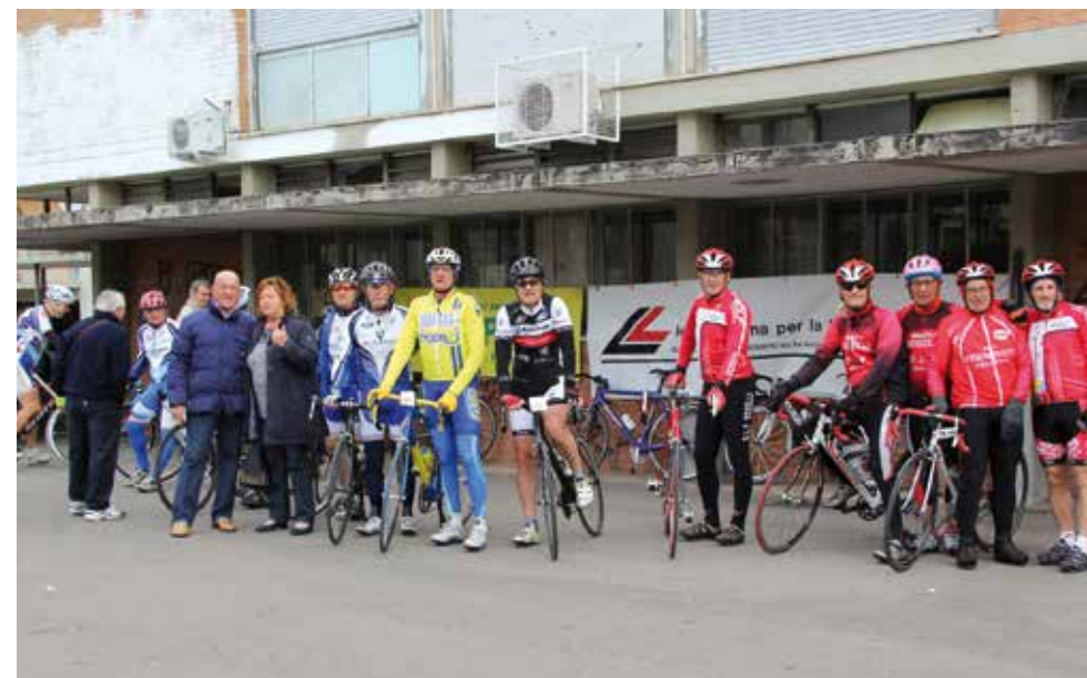
LILT e UISP insieme per la Prevenzione

Divulgazione di materiale informativo con opuscoli forniti dalla Sede Centrale della LILT; attività ambulatoriale con esami diagnostici.