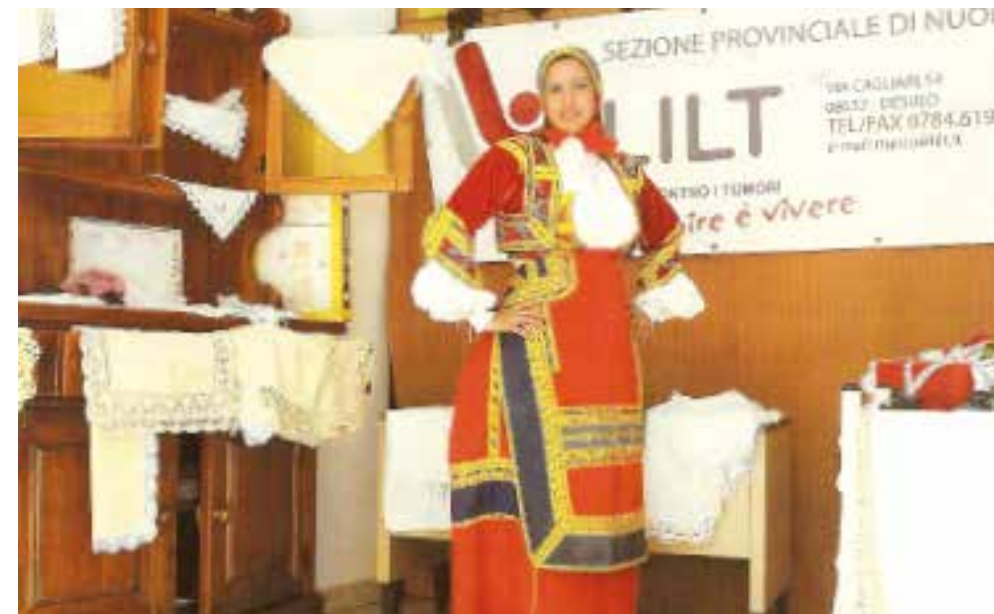
Manifestazione "La motagna produce" I volontari della LILT di Nuoro per raccolta fondi