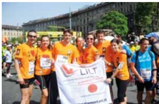
Aprile 2015 - Milano Marathon!

Tra le iniziative della Giornata Mondiale senza tabacco da segnalare: la festa "Missione LILT-Agenti Speciali in Azione", promossa nelle classi 4^ delle scuole primarie di Milano e provincia, nell'ambito della tradizionale campagna di prevenzione al tabagismo nelle scuole; l'iniziativa "Un lenzuolo contro il fumo" nei cortili di 15 Istituti superiori per una "Scuola libera dal fumo" con la distribuzione di depliant e gadget in cambio della sigaretta.