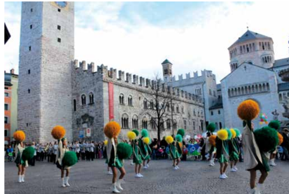
Le majorette in Piazza Duomo a Trento per l'inaugurazione dell'Appartamento LILT per ospitare i piccoli pazienti e i genitori

L'abituale attività di sensibilizzazione ed educazione alla salute si è arricchita con una stimolante esperienza condotta in collaborazione col Comitato trentino UISP ed altre associazioni legate a patologie varie (malati reumatici, alzheimer, ecc.). Il progetto "Promuoviamo la salute", finanziato dal CSV, ha previsto un percorso formativo rivolto a operatori sportivi, volontari, educatori per l'acquisizione di