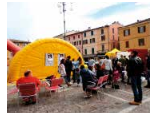
In piazza per la Prevenzione

Nell'ambito del "Progetto Martina - Parliamo con i giovani dei tumori", che vede il patrocinio della LILT sono stati realizzati 2 incontri dal titolo "Prevenzione primaria, Prevenzione secondaria del tumore della mammella, della cervice uterina, del melanoma", che hanno visto la partecipazione degli alunni del III Liceo Classico Mamiani di