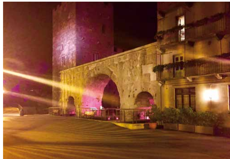
Le Porte Praetoriane illuminate per la Campagna "Nastro Rosa"