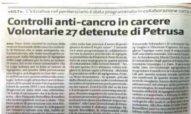
Nastro Rosa LILT per le ospiti della casa circondariale di Petrusa

"io scelgo di vivere bene" è un progetto pilota, il nome del progetto mette in luce l'o-