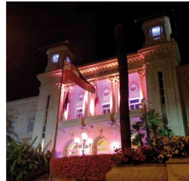
Il Casinò di Sanremo illuminato per la Campagna Nastro Rosa

La fornitura di presidi (carozzelle, letti, materassini antidecubito ecc.) è molto apprezzata dall'utenza che usufruisce inoltre del servizio di consulenza e aiuto con un numero di telefono dedicato, aperto tutti i giorni e disponibile per semplici informazioni o accompagnamento passo per passo verso le complicate procedure burocratiche. I famigliari dei malati oncologici mostrano spesso la loro gratitudine con piccole e grandi donazioni.