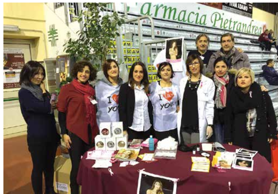
I volontari della LILT Frosinone per "Nastro Rosa"

Nel mese di Ottobre oltre alla visita di prevenzione gratuita effettuata nella nostra sede, in collaborazione con la ASL di Frosinone sono state effettuate ecografia e mammografia a scopo preventivo.