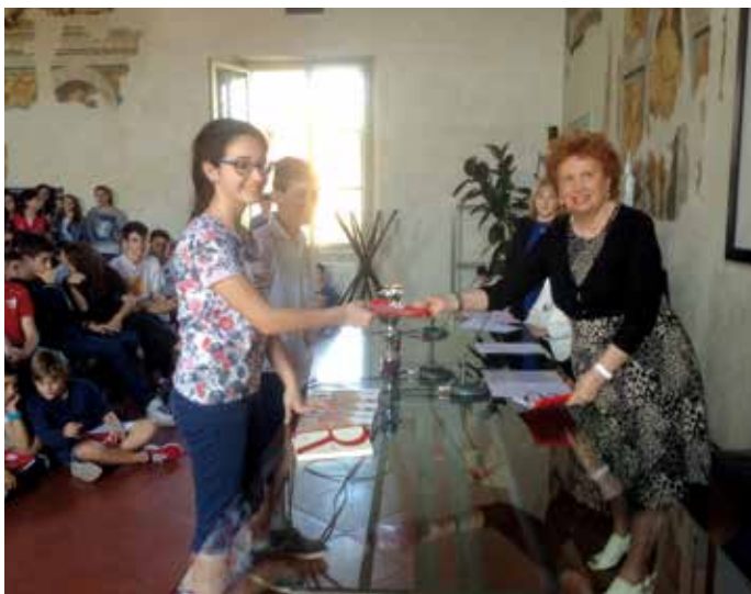
31 Maggio 2015 - Tradizionale appuntamento per premiare gli studenti che hanno lavorato a progetti promossi dalla Lilt in materia di lotta al tabagismo

La Lilt di Mantova esercita la sua attività istituzionale estesa alla popolazione mettendo a disposizione del territorio provinciale i seguenti servizi: ambulatori con visite ginecologiche e Pap-