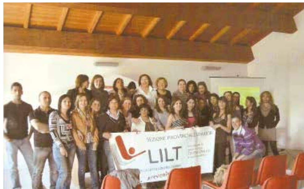
Incontro di formazione per i 35 volontari LILT Nuoro