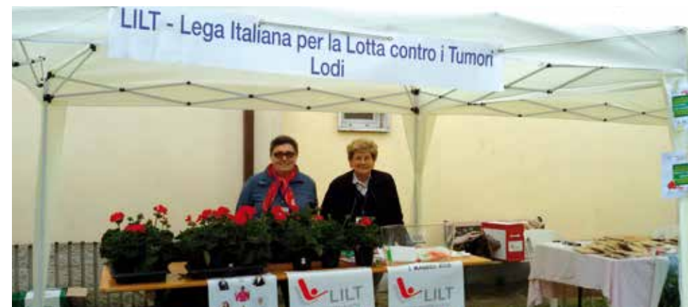
In piazza per la Settimana Nazionale per la Prevenzione Oncologica

Si è approfittato di una Serata Danzante, con il "Ballo di Inizio Estate", per dif-