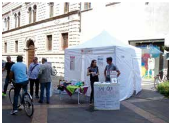
Stand in Piazza a Trento per la GMST

Il Servizio Accoglienza Bambini in Oncologia Pediatrica prende ufficialmente avvio con l'inaugurazione