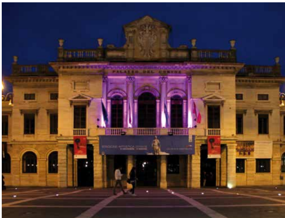
Palazzo comunale illuminato per Nastro Rosa

Per la Giornata Mondiale senza Tabacco il Rotary Club di Savona ha organizzato nella Sala della Sibilla del complesso del Priamar un Convegno rivolto alle scuole superiori di Savona e provincia sul tema delle dipendenze (fumo e alcol) e i cor-