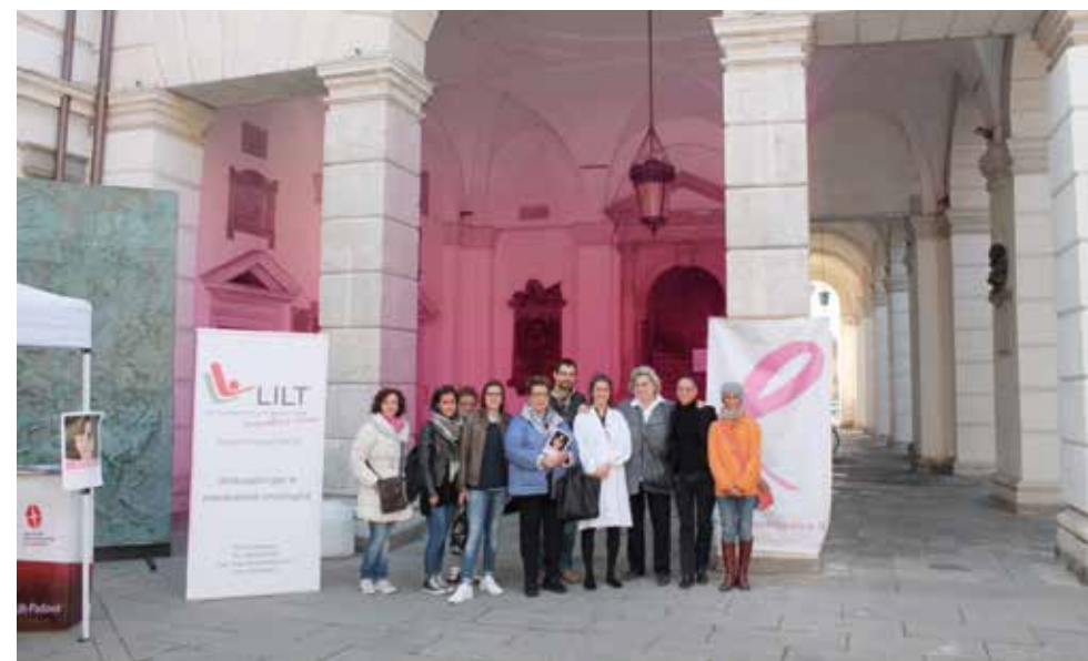
Giornata Nastro Rosa, Comune di Montagnana