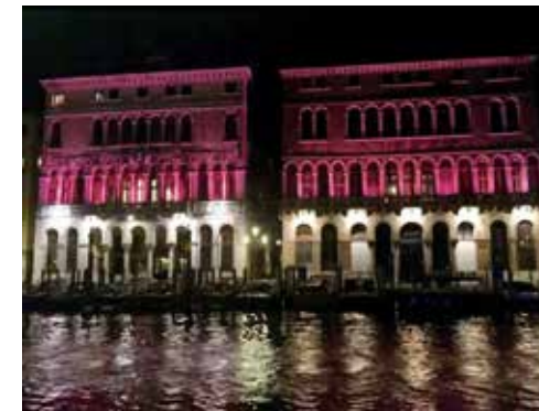
Ca' Loredan illuminata per "Nastro Rosa"

È stata organizzata una Cena Sociale nel bellissimo contesto di Villa Braida, finalizzata alla raccolta fondi per sostenere il servizio di micro pigmentazione.