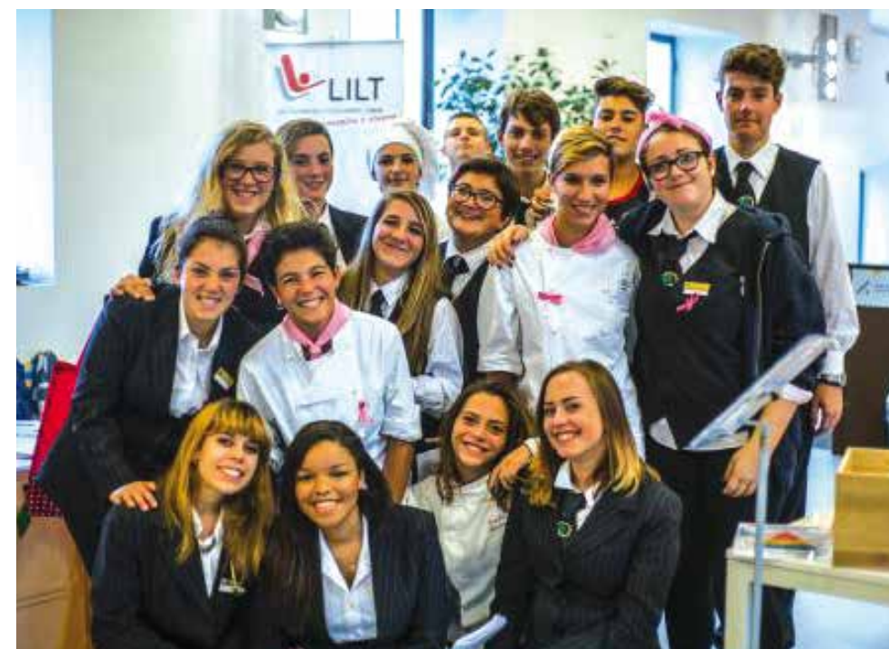
Giovani protagonisti nell'educazione tra pari

La LILT di Reggio Emilia coordina il Programma Scegli con Gusto Gusta in Salute su Prevenzione Oncologica, Alimentazione e Movimento che coinvolge l'80% degli Istituti Alberghieri della Regione Emilia Romagna con la partecipazione di circa 3000 studenti, 100 docenti e diversi genitori e referenti degli Enti locali e del Privato Sociale. Gli Istituti della Regione tengono regolarmente a LdP laboratori di cucina didattica per la prevenzione oncologica con la supervisione di nutrizionisti rivolti a diversi target: volontari, ammalati neoplastici, operatori sanitari, studenti coinvolti nella educazione fra pari. A maggio 2015 si è tenuta uno degli eventi più significativi del percorso progettuale.