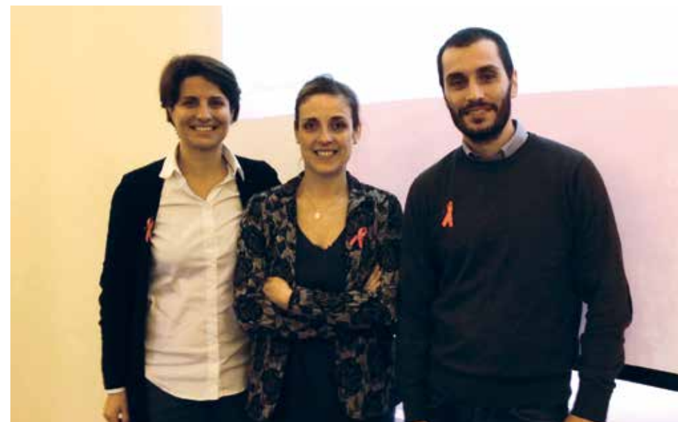
I giovani ricercatori del NEST della Scuola Normale Superiore di Pisa per il Nastro Rosa

Partecipazione alle Campagne Nazionali per la Lotta contro il fumo nelle scuole della nostra città.