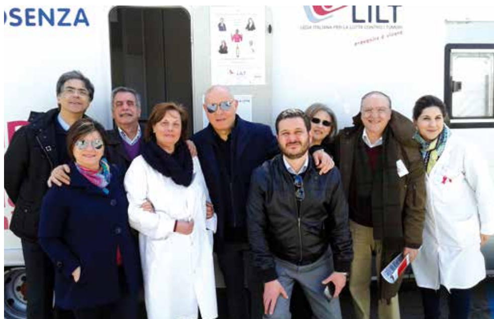
I medici di LILT Cosenza in piazza con il camper

Vi è stata una notevole partecipazione di pazienti che gratuitamente sono stati sottoposti alle suddette indagini. Inoltre sono stati allestiti degli stand per la distribuzione delle bottiglie di olio extravergine di oliva, simbolo della Dieta Mediterranea e grande alleato nella lotta contro i tumori, e di opuscoli informativi sul tema della sana alimentazione, nei seguenti luoghi: