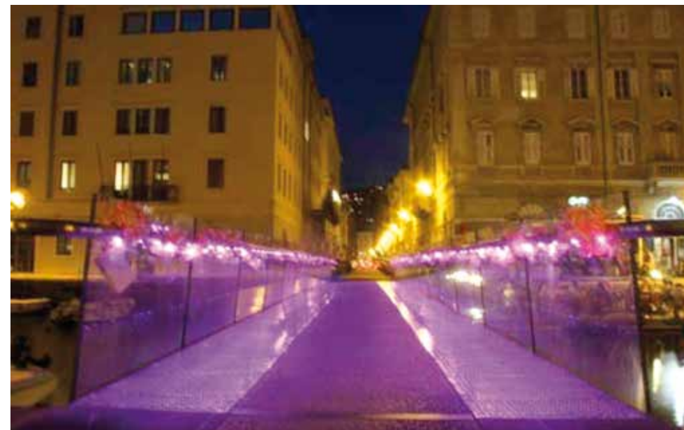
Passaggio Joyce - Ponte Curto illuminato per la Campagna "Nastro Rosa"