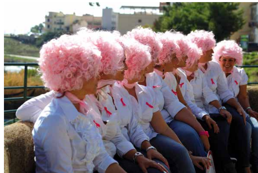
Ottobre "Campagna Nastro Rosa"

11-12 Giugno: XIFONIO CUP. Stand LILT allo "XIFONIO VILLAGE" allestito all'interno della Base della Marina Militare "Marisicilia" ad Augusta; stand Istituzionali, delle Forze Armate, di Polizia e di volontariato, di artigianato locale e degustazione dei prodotti tipici; presso il centro sportivo della Marina quattro mostre; visite a bordo