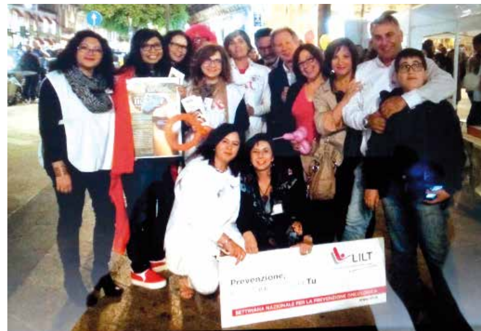
LILT Ragusa a Modica per la Prevenzione

PREVENZIONE SECONDARIA: ambulatori di prevenzione secondaria LILT per la prevenzione dei tumori al seno, alla pelle, all'apparato oro-faringeo, apparato respiratorio, prostata ed esami ecografici per la prevenzione del tumore al seno ed alla tiroide. Convenzione con il Sindacato Cisl postali e con la Banca Agricola di Ragusa per visite di prevenzione ai propri iscritti/dipendenti. Perorsi per smettere di fumare. PREVENZIONE TERZIARIA: convenzione con l'ASP di Ragusa per la collaborazione di 20 volontari LILT all'interno dell'Hospice di Modica a supporto del personale sanitario nel sostegno del malato terminale. Convenzione con l'ASP di Ragusa che prevede la presenza di una psicologa LILT all'interno del reparto di chirurgia generale dell'Ospedale Civile di Ragusa per il sostegno dei pazienti oncologici.