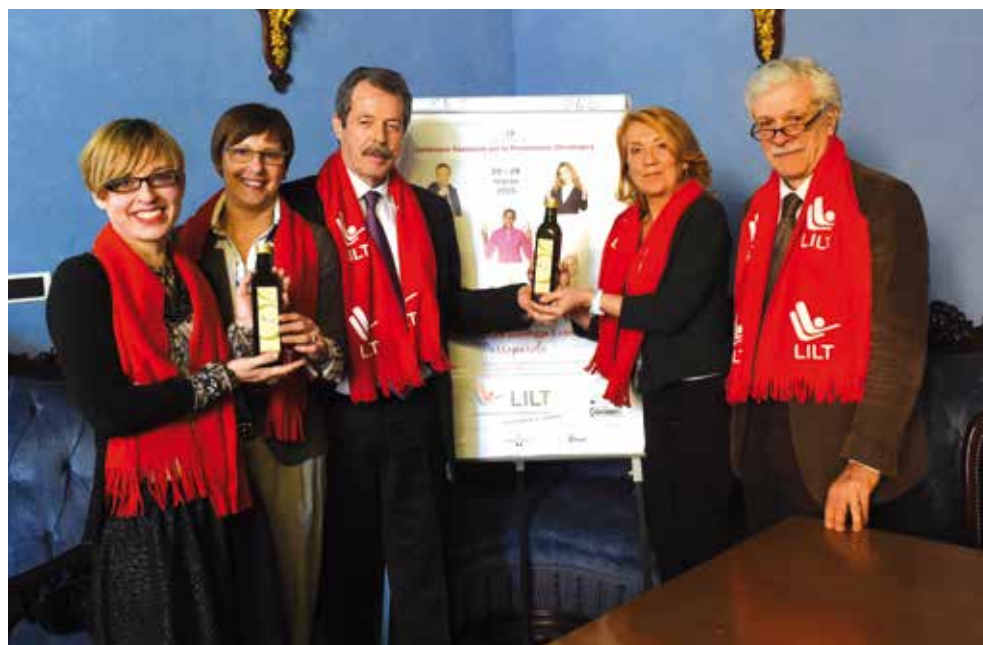
Conferenza stampa per SNPO

La Giornata Mondiale Senza Tabacco vede la Sezione bolognese della Lilt impegnata soprattutto nelle scuole della provincia. Sono, infatti, ormai alcuni anni in cui la