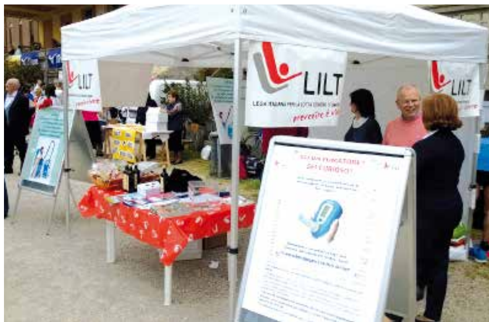
LILT Ferrara al tradizionale "Giro Podistico delle Mura Estensi"

In data 16 e 17 Ottobre è stato allestito un punto informativo presso un Centro Commerciale della Provincia (Coop Estense), a cui ha fatto seguito in data 20 Ottobre un incontro aperto al pubblico dedicato alla prevenzione con particolare riferimento al tumore al seno e ai tumori femminili.