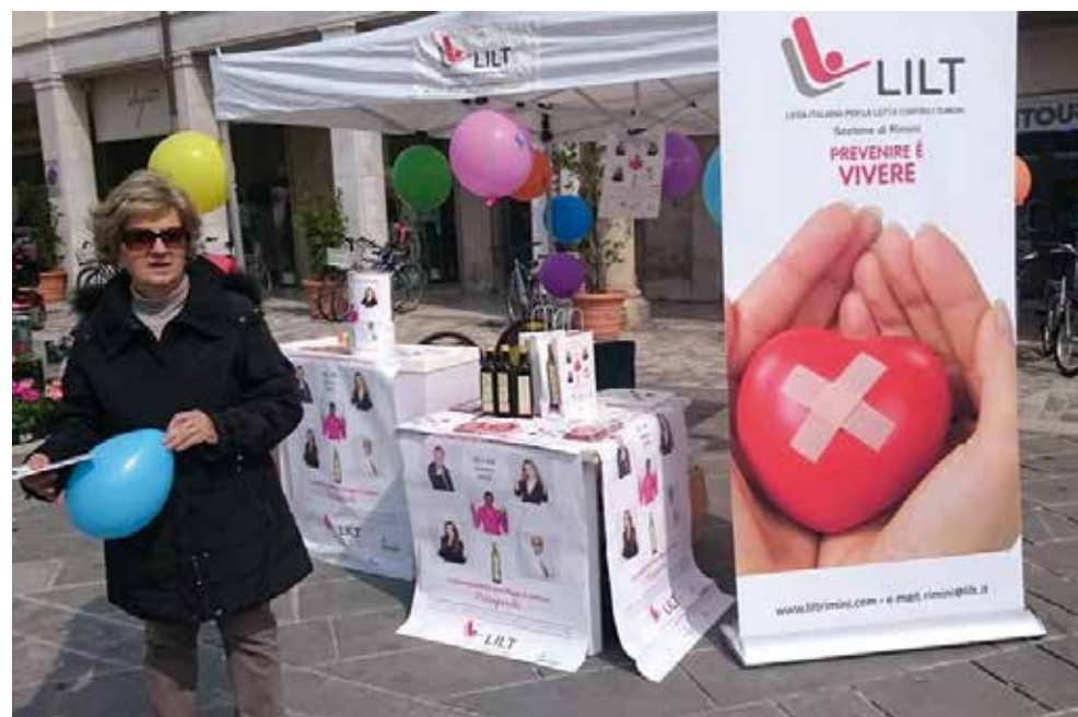
LILT Rimini in piazza per SNPO

È stato presentato e svolto un progetto sulla "psicomotricità" nelle stesse scuole dell'Infanzia ed anche con alunni di diversi comuni presso il centro commerciale Befane shopping centre in occasione della giornata "Save the world".