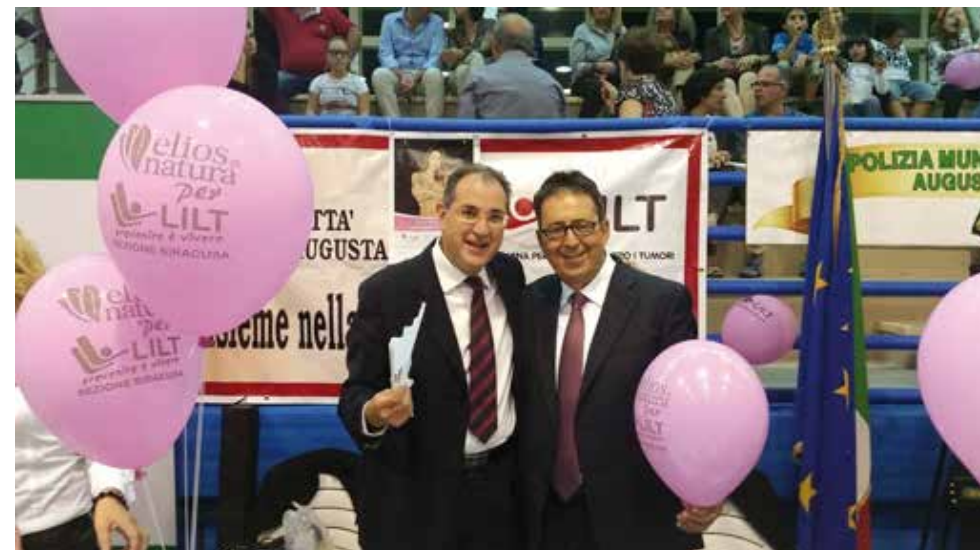
Manifestazione LILT Siracusa per Nastro Rosa

17 ottobre: Convegno in Rosa "La prevenzione oncologica al femminile", presso la sala consiliare del Palazzo di Città del comune di Melilli. A seguire "La solidarietà IN MUSICA".