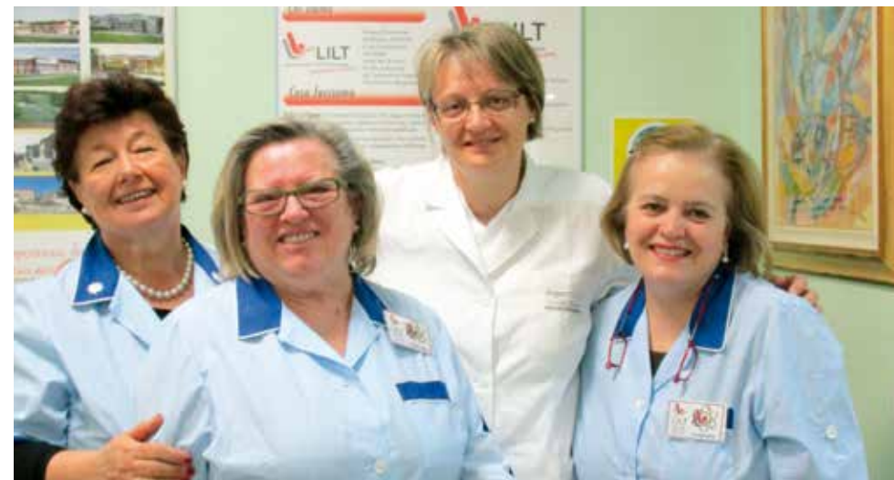
Volontarie ospedaliere del Gruppo Aurora presso la Radioterapia del Policlinico

È proseguita la realizzazione del Centro di Riabilitazione Oncologica Casa Luce e Sorriso a Casola di Montefiorino, già attivo nel periodo estivo con fini di soggiorno.