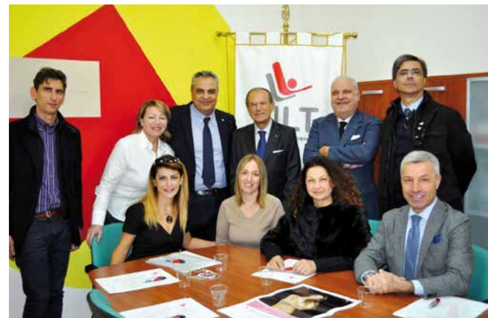
Presidente Nazionale, Vicepresidente Nazionale e Presidenti di Sezioni Provinciali LILT