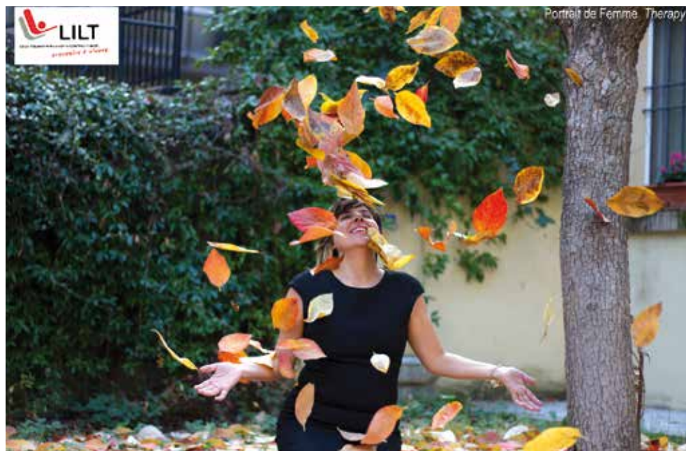
Nastro Rosa 2015, "Portrait de Femme"

Nel 2015 è stato avviato presso la sede della sezione un servizio di consulenza genetica: lo sportello informativo su "tumori e familiarità", nato dalla collaborazione tra LILT e Ambulatorio di Genetica Oncologica (UO Genetica Medica) del Policlinico