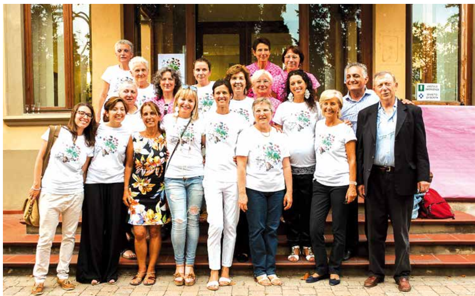
La LILT di Firenze

Nel 2015 è stata infine festeggiata l'apertura della Delegazione comunale LILT Scandicci, per rendere ancora più capillare l'azione sul territorio.