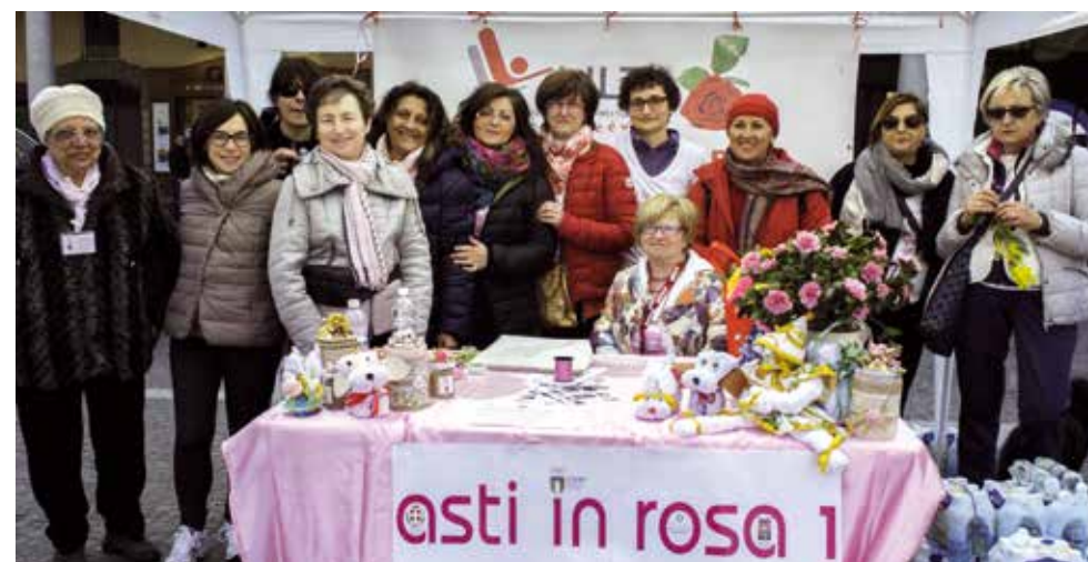
Asti in Rosa

Le attività e le nuove iniziative svolte nel corso del 2015 sono state determinate sia per sensibilizzare la collettività sull'importanza della diagnosi precoce e conso-