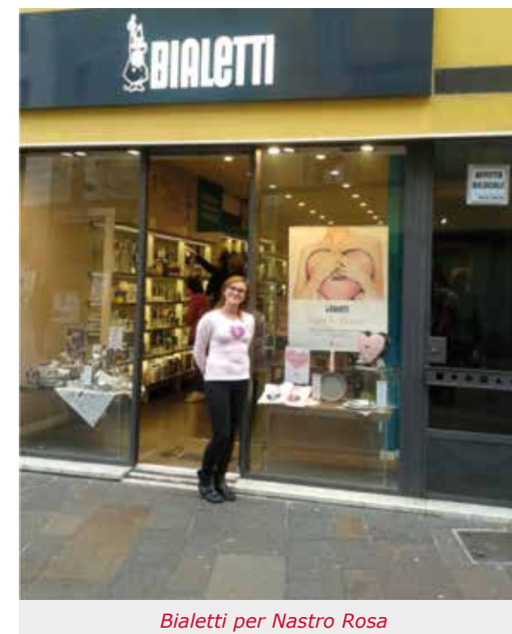
Bialetti per Nastro Rosa

Presso gli ambulatori LILT di Trescore B. e di Verdello sono state effettuate visite di prevenzione per Senologia, Urologia, Dermatologia, ORL; a Trescore B. e a