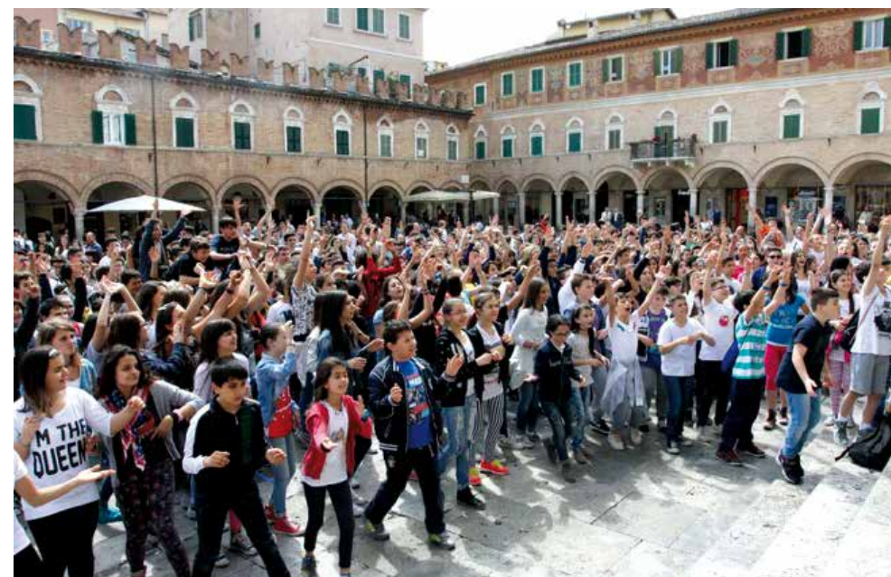
Il Flash Mob in Piazza del Popolo ad Ascoli Piceno - Giornata Mondiale senza Tabacco 2015

Convegno "LA SALUTE VIEN MANGIANDO" aspetti fisiologici e patologici dell'alimentazione nell'infanzia e nell'adolescenza. Palazzo dei Capitani - ASCOLI PICENO Sabato 19 settembre 2015. Convegno medico con ECM organizzato in collaborazione con AIDM Associazione Italiana Donne Medico, Sezione di Ascoli Piceno.