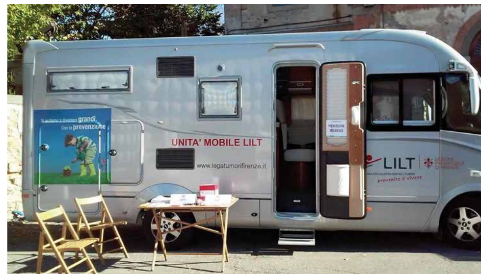
Unità mobile LILT Firenze "Vi aiutiamo a diventare grandi con la prevenzione"

Sul versante dell'assistenza domiciliare, la Lilt ha incrementato l'attività del Servizio Camo-Centro di Aiuto al Malato Oncologico che si occupa di portare ausili sanitari a casa dei pazienti in fase avanzata di malattia e ha confermato l'impegno per un medico palliativista a sostegno dell'Azienda Sanitaria Firenze.