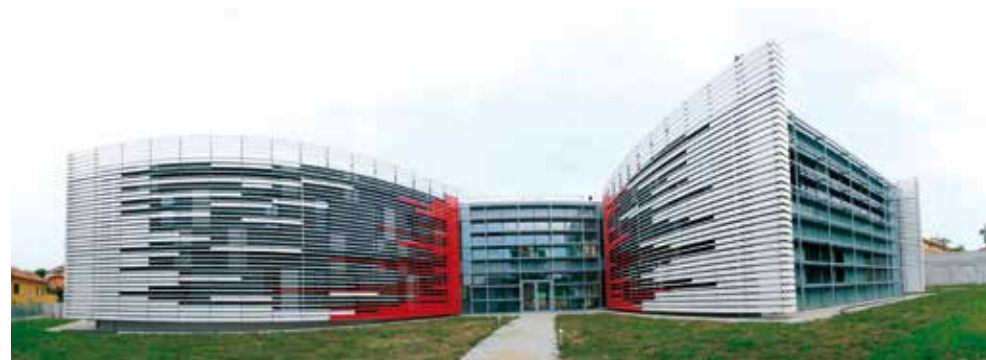
Spazio LILT settembre 2015

Ambulatorio Medico di Agopuntura oncologica: si rivolge a persone in trattamento chemioterapico o con effetti collaterali da farmaci. Le visite nel 2015 sono state 244. Oltre al costante reperimento ed alla formazione di volontari impegnati nel sup-