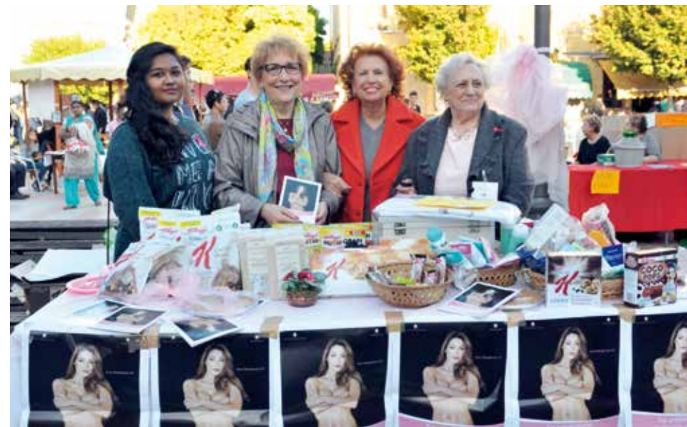
Le Volontarie con la Presidente Lilt - Pegognaga

test, visite senologiche, mammografie ed ecografie, visite al cavo orale, visite di orientamento e consulenza psicologica, percorsi per smettere di fumare, educazione alla salute nelle scuole di ogni ordine e grado.