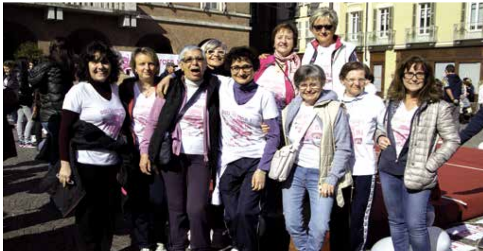
Camminata in Rosa

lidare un'informazione e un'educazione alla salute sempre più propositiva e concreta a favore della prevenzione, sia ad incrementare la raccolta fondi a sostegno dei progetti stessi.