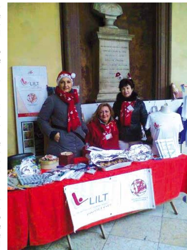
LILT Reggio Emilia in piazza per raccolta fondi