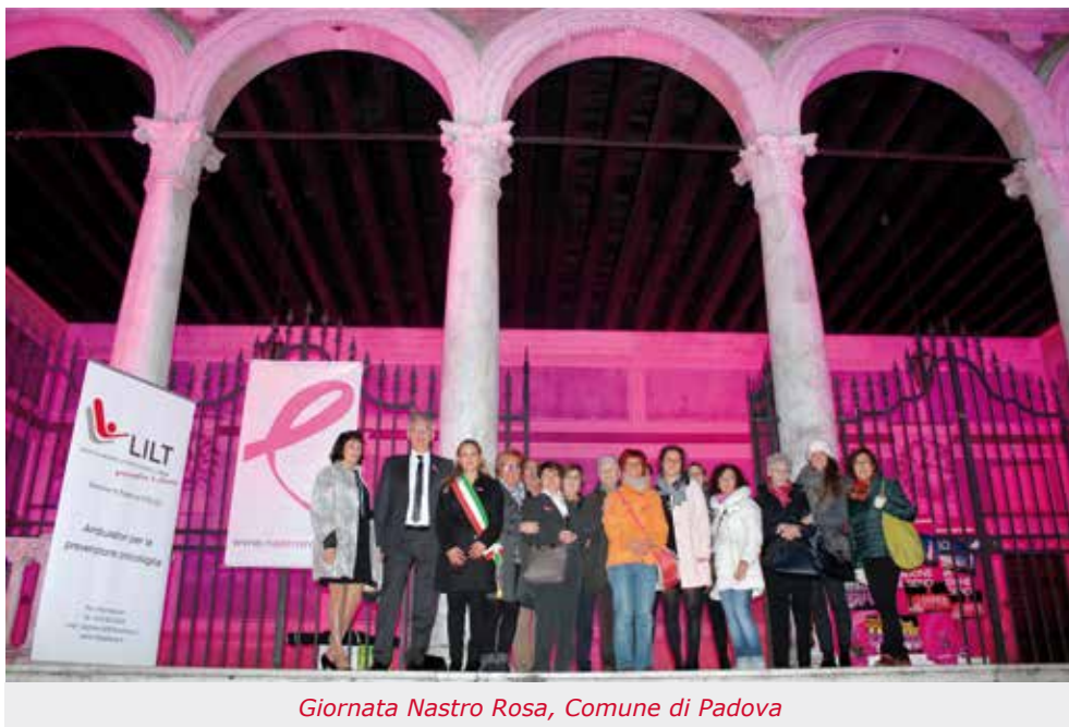
Giornata Nastro Rosa, Comune di Padova