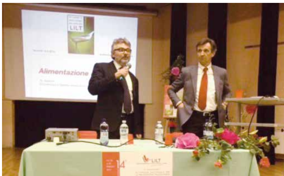
SNPO 13 marzo 2015 - Auditorium Pallanza Sant'Anna - Conferenza della LILT sul tema: "Un corretto stile di vita per prevenire il tumore"

Alla cena hanno partecipato circa 200 persone provenienti da tutto il VCO vicine alle Associazioni interessate, che hanno partecipato alla festa con i loro rappresentanti.