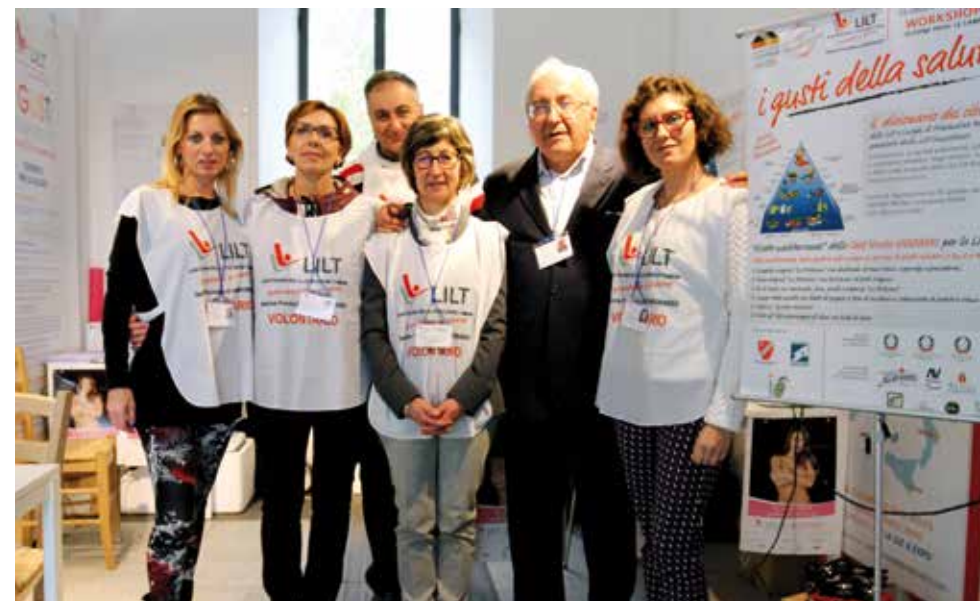
Lilt di Campobasso ad EXPO 2015-Milano

Nell'ultimo anno l'azione di Prevenzione Primaria oncologica è stata prevalentemente orientata alla riscoperta della Dieta Mediterranea e alla diffusione di corretti stili di vita nelle famiglie e tra i giovani, per combattere la occidentalizzazione della