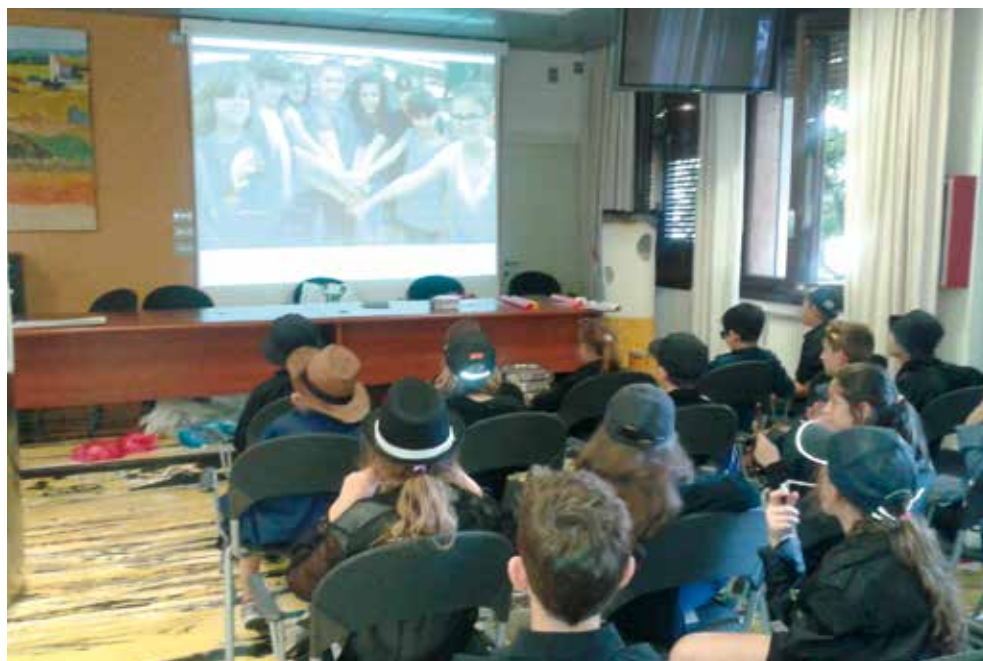
Agente 00sigarette, premiazione presso l'ASL di Bergamo di alcune classi di studenti

La GMST ha visto protagonisti i bambini della scuola media di Dalmine, che hanno distribuito materiale informativo e mele in cambio di sigarette presso l'Azienda Ospedaliera Papa Giovanni XXIII° di Bergamo; alcune classi della scuola primaria di Bergamo, sono state coinvolte nel progetto "Agente 00sigarette", premiate presso l'ASL di Bergamo nel mese di giugno. La delegazione di Clusone ha diffuso spot televisivi utilizzando materiale realizzato dai ragazzi della scuola primarie.