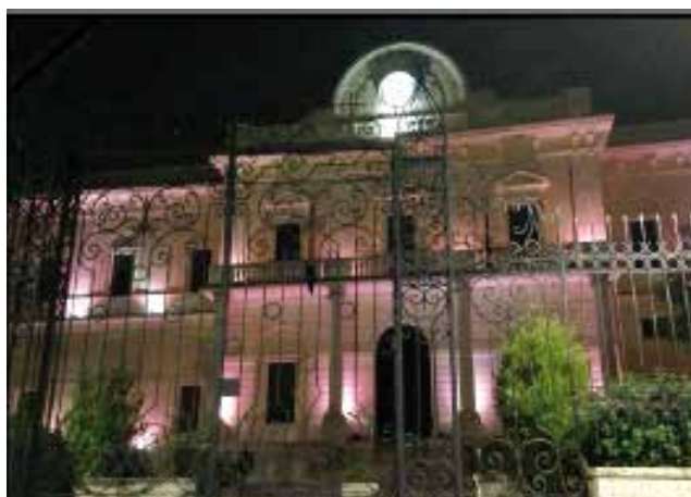
Delegazione LILT Bari, Municipio di Gravina in Puglia illuminato per Nastro Rosa

Una nuova struttura sanitaria per la prevenzione e