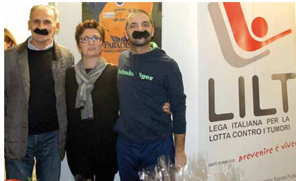
Campagna di sensibilizzazione per la prevenzione del tumore alla prostata "Movember"

La premiazione si è svolta nell'ambito della Festa della Prevenzione , un evento che si è ripetuto per il secondo anno con grande successo al termine dell'anno scolastico nel giardino della sede LILT di Merate.