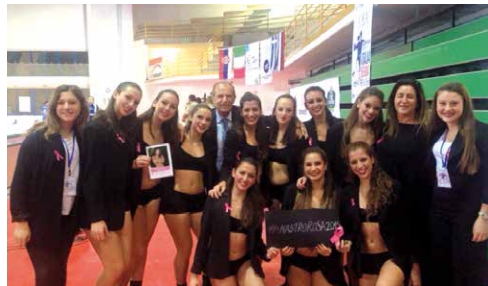
LILT di BAT con il Presidente Nazionale, Palasport di Andria Incontro di pallamano femminile - Qualificazione europei 2016

TRANI (BT) - organizzata dalla Pro Loco di Trani "La Dolce Disfida" 2 a edizione in collaborazione con la LILT BT, la Strada dei Vini DOC Castel del Monte e il Patrocinio del Comune di Trani. L'evento, rientrante nel calendario della Festa Patronale, ha promosso il sostegno alle Campagne Nazionali per la Prevenzione Oncologica della LILT durante il quale è stato allestito un desk informativo sulla Prevenzione Oncologica.