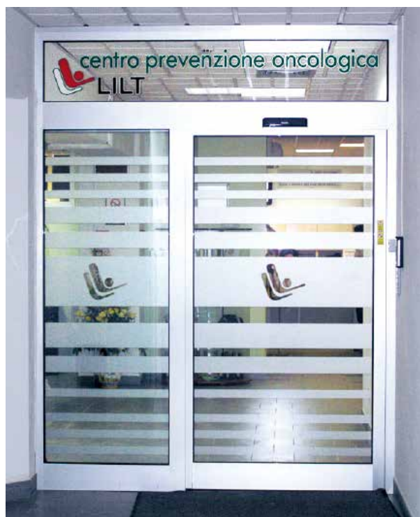
Ingresso del Centro di Prevenzione Oncologica della LILT di Siena

Dall'ANALISI DELLE USCITE risulta evidente la diretta correlazione con l'attività istituzionale e con lo scopo sociale perseguito.