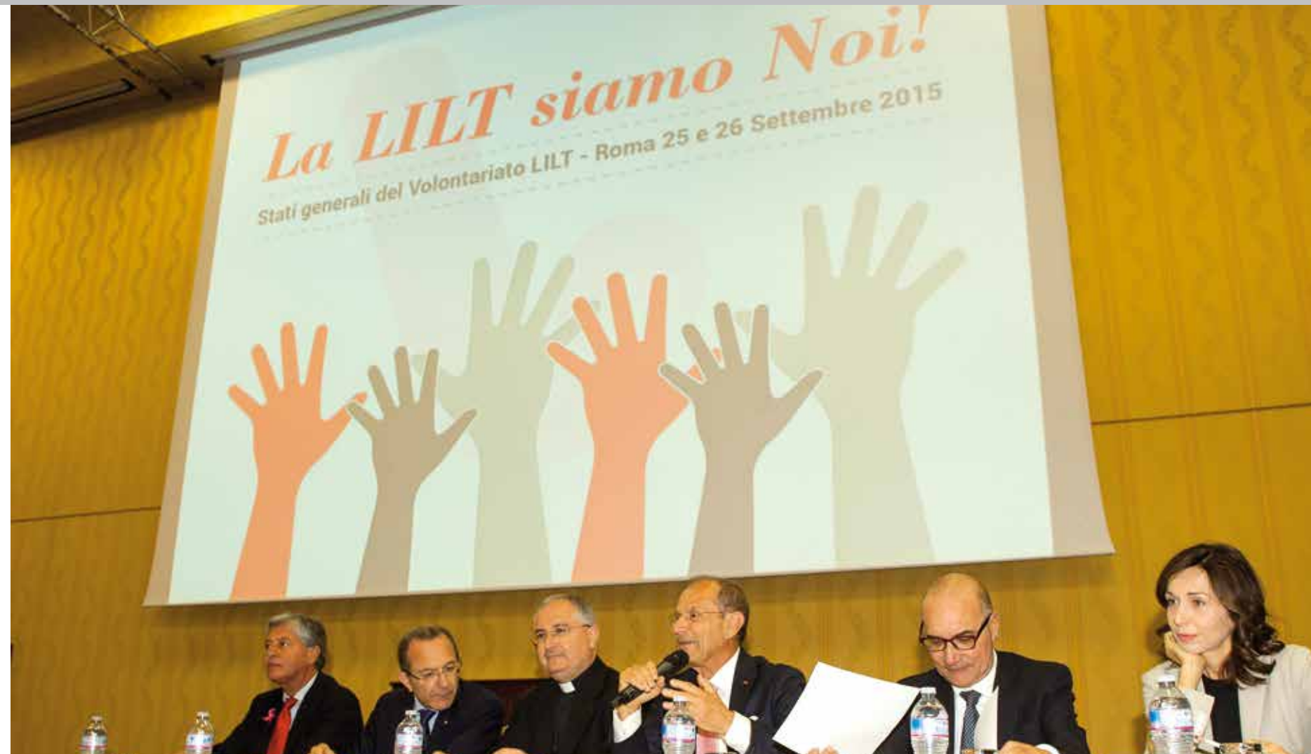
"Stati Generali del Volontariato LILT" - 25 e 26 settembre 2015 - Marriott Park Hotel di Roma