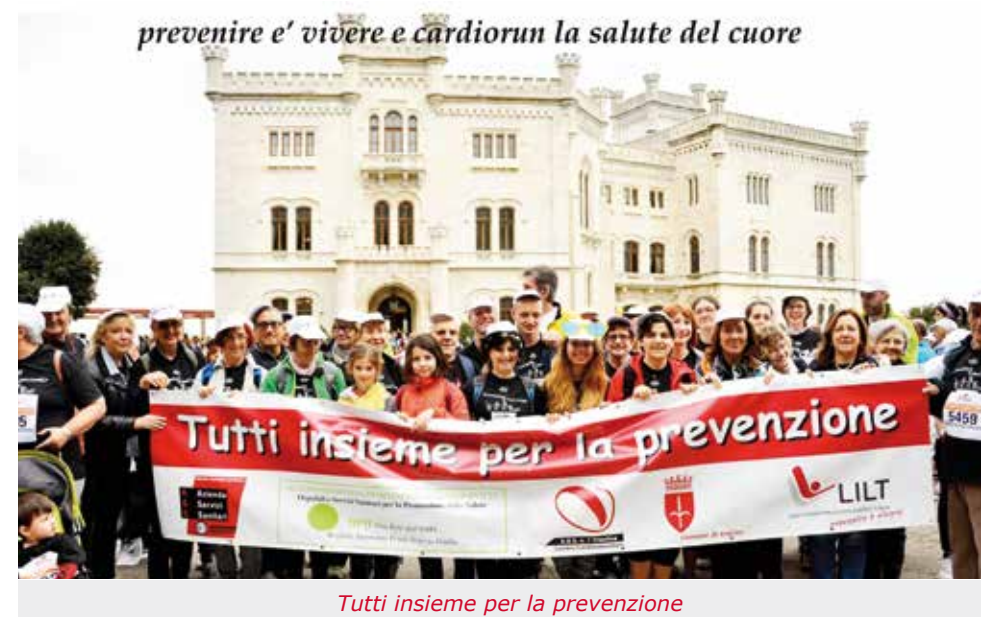
Tutti insieme per la prevenzione

29 e 30 maggio: in collaborazione con il Dipartimento delle Dipendenze e il Centro Cardio Vascolare dell'Azienda per l'Assistenza Sanitaria n.1 Triestina misurazione percentuale di monossido di carbonio e la pressione arteriosa al banchetto allestito