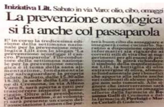
Cremona "La Provincia" 23 marzo 2015

Grande successo dell'iniziativa tenutasi il 28 marzo presso la sede di Cremona riguardo all'offerta dell'OLIO LILT, che è stata accompagnata dalla presenza di un cuoco che ha suggerito ricette e ha proposto assaggi di cibi utili per la prevenzione e allo stesso tempo ottimi.