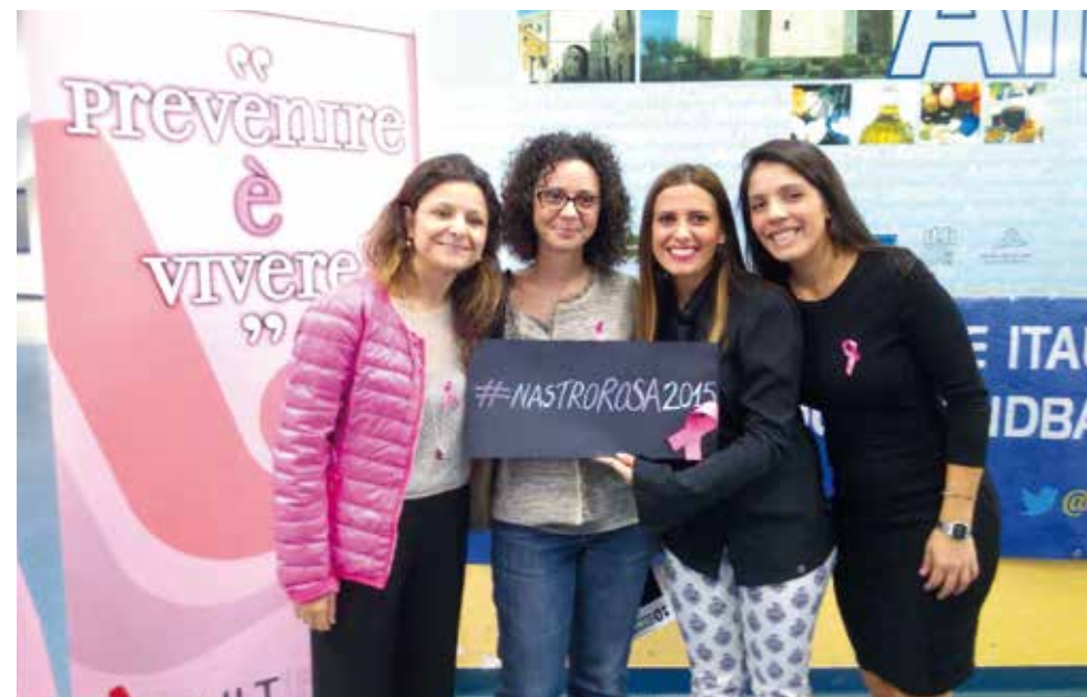
Le volontarie di LILT BAT