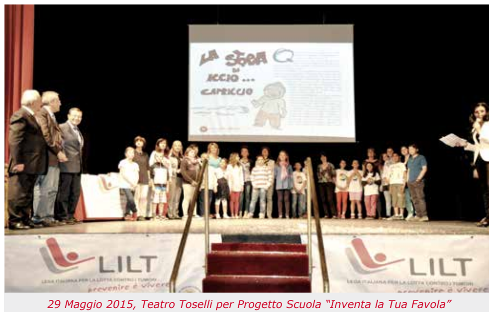
29 Maggio 2015, Teatro Toselli per Progetto Scuola "Inventa la Tua Favola"