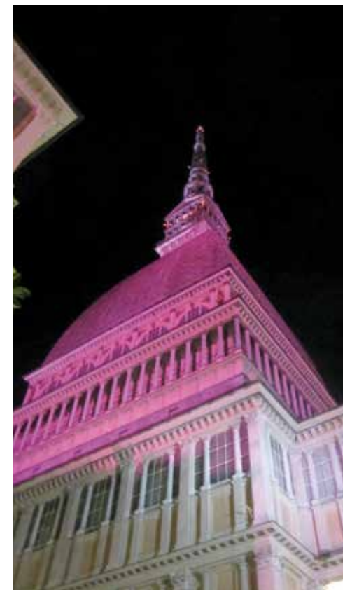
La Mole Antonelliana illuminata per la Campagna "Nastro Rosa"

27 novembre: Tavola rotonda di approfondimento ed una rappresentazione teatrale "Un Segreto da condividere". Progetto di sensibilizzazione sul carcinoma prostatico organizzato in collaborazione con Janssen Pharmaceuticae Europa Uomo promosso nell'ambito di "Movember" manifestazione mondiale dedicata alla prevenzione e alla sensibilizzazione sul tumore della prostata.