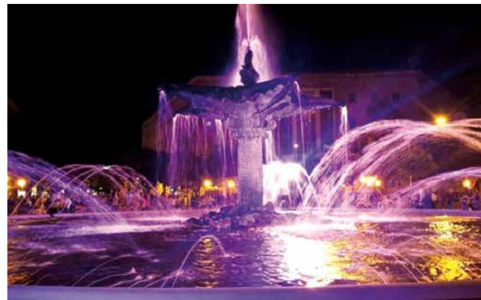
Fontana del parco urbano dedicata a Karol Wojtyła