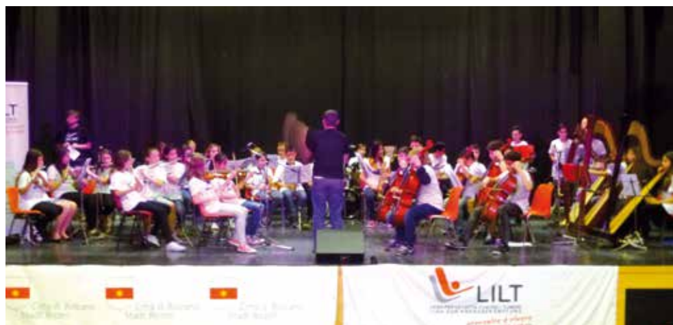
31 maggio 2015

Causa allagamento della sede tutte le attività di visite e conferenze sono state annullate.