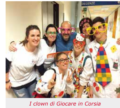
I clown di Giocare in Corsia