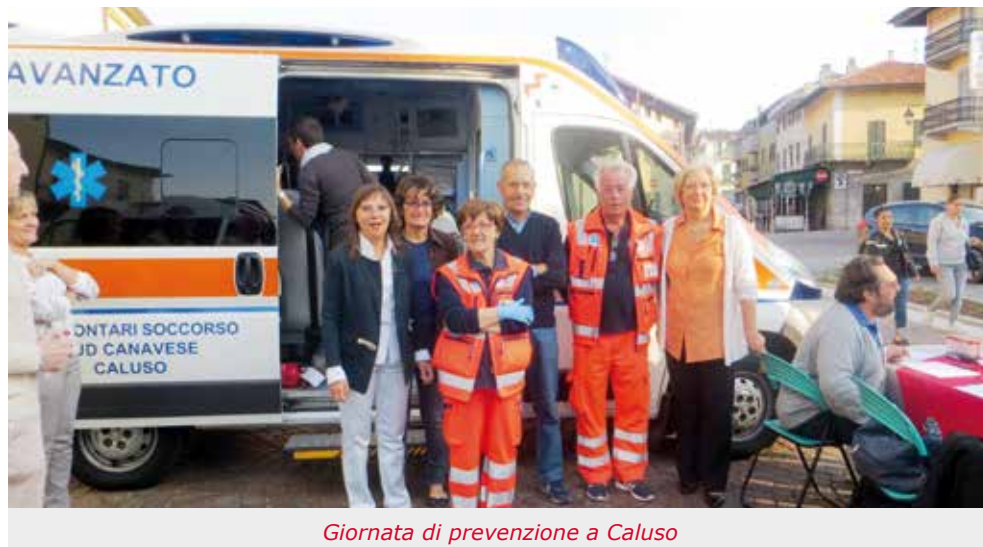
Giornata di prevenzione a Caluso

Prevenzione secondaria: sabato 25 settembre 2015 Giornata della prevenzione presso la Delegazione di Caluso in Piazza Mazzini, con la collaborazione dell'AVIS Caluso, del Lions Club Caluso Canavese sud Est, dei Volontari Soccorso Sud Canavese ed el Centro Diagnostico Ciglianese. Durante tale giornata si sono svolte numerose prestazioni diagnostiche preventive (PSA, Visite oculistiche, Visite otorinolaringoiatria, visite MOC) a cui hanno aderito circa 250 persone creando così un importante appuntamento annuale in accordo con le linee guida della prevenzione