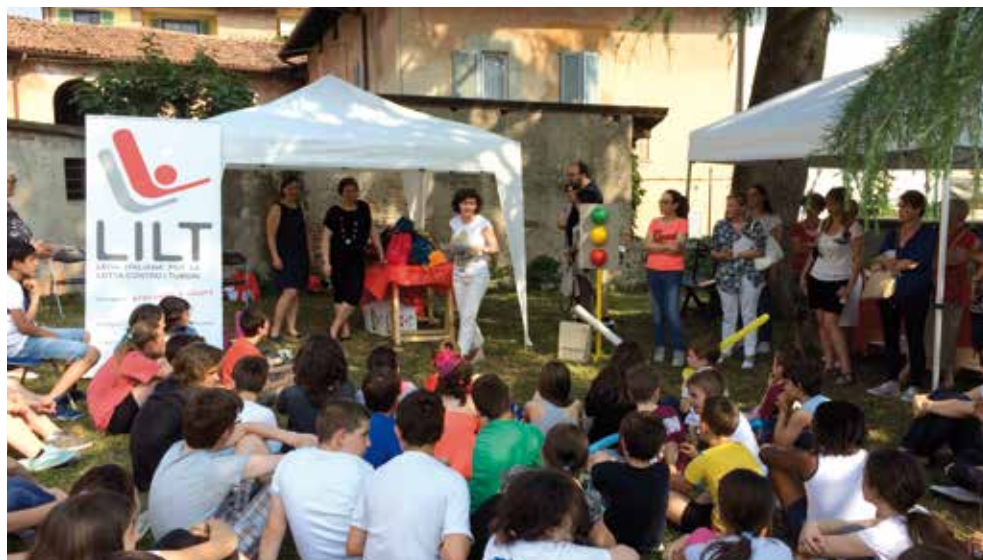
"Festa della Prevenzione" campagna di sensibilizzazione per educare i ragazzi ai corretti stili di vita

Nel corso di tutto l'anno 2015, la Sezione Provinciale di Lecco ha svolto un'intensa opera di sensibilizzazione ed informazione, in collaborazione con le scuole primarie e secondarie di I e II grado, per educare i ragazzi a corretti stili di vita e ad una sana alimentazione e per diffondere tra i giovani la consapevolezza dei danni del