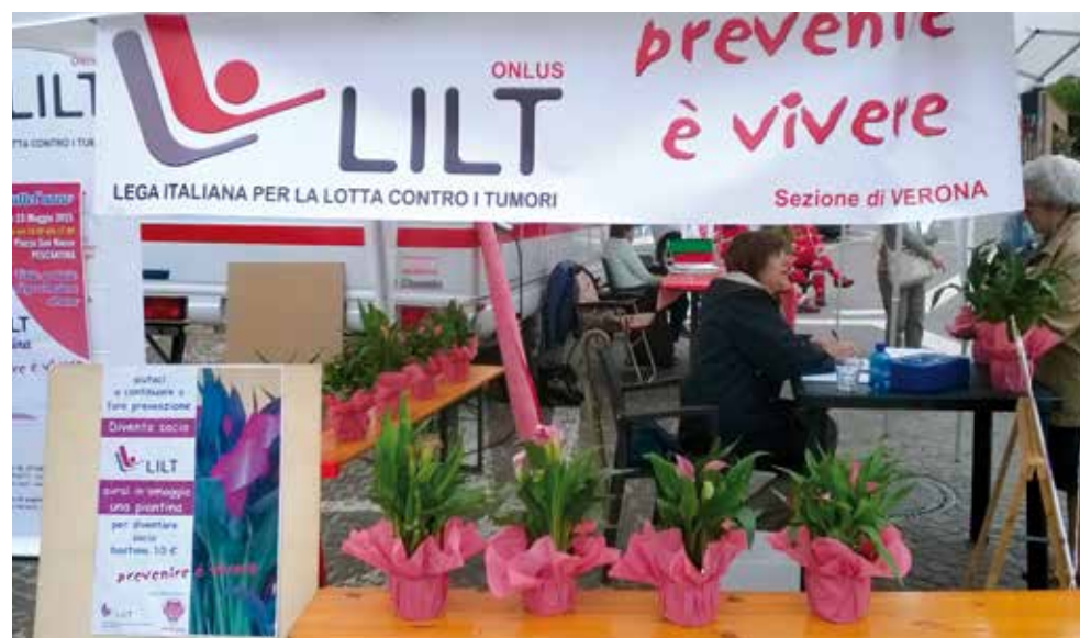
Pescantina 23 Maggio

presso LILT " in collaborazione con la Chirurgia Generale dell'Ospedale "Sacro Cuore di Negrar".