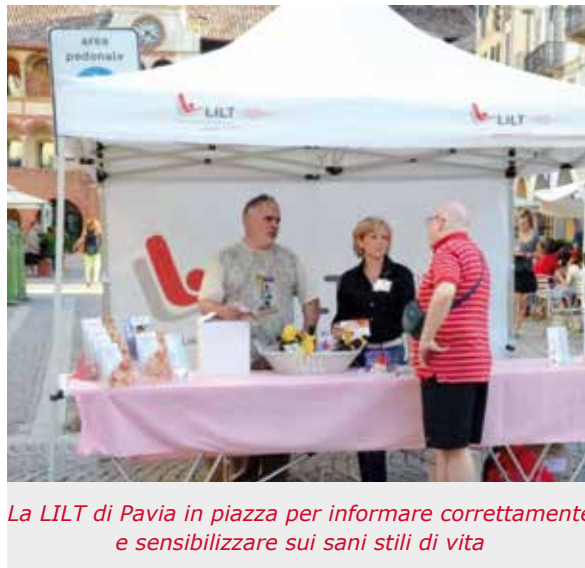
La LILT di Pavia in piazza per informare correttamente e sensibilizzare sui sani stili di vita

La Campagna Nastro Rosa durante la quale per tutto il mese di ottobre e oltre si sono offerte visite senologiche, quale primo passo per sensibilizzare le persone alla prevenzione del tumore della mammella, in particolare, e dei tumori in generale. Come è ormai tradizione il palazzo Mezzabarba e il Broletto sono stati illuminati di rosa grazie all'impegno del Comune di Pavia, in particolare nella persona del Sindaco e dell'Assessore ai Servizi Sociali. Durante la campagna "Nastro Rosa 2015" sono state eseguite presso l'ambulatorio LILT circa 600 visite senologiche gratuite.