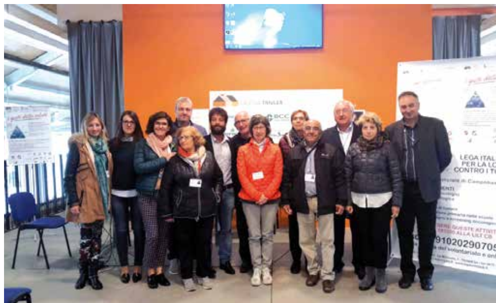
EXPO 2015-Gruppo di lavoro LILT di Campobasso

Negli stessi giorni sono stati allestiti negli atri degli ospedali a Campobasso, Termoli e Larino e in piazza Monumento a Termoli, alcuni punti informativi sulle attività della LILT con la distribuzione degli opuscoli e nastrini.