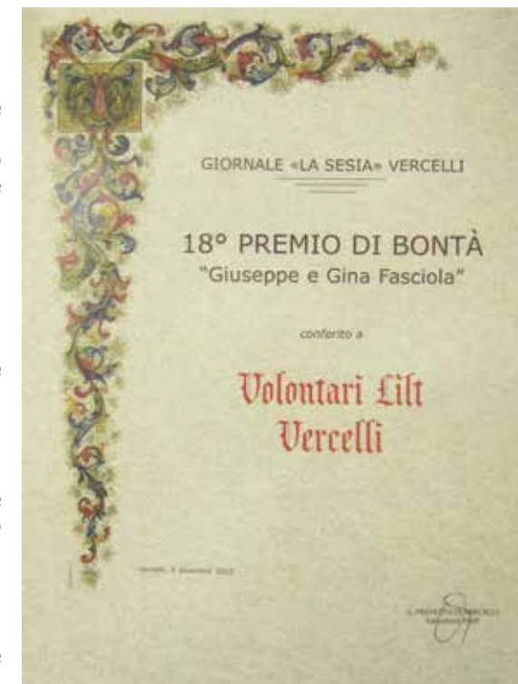
Attestato Premio Bontà 2015

In diversi Comuni della nostra Provincia i Volontari pubblicizzano l'evento con la distribuzione di materiale informativo specifico. In Vercelli è stata organizza-