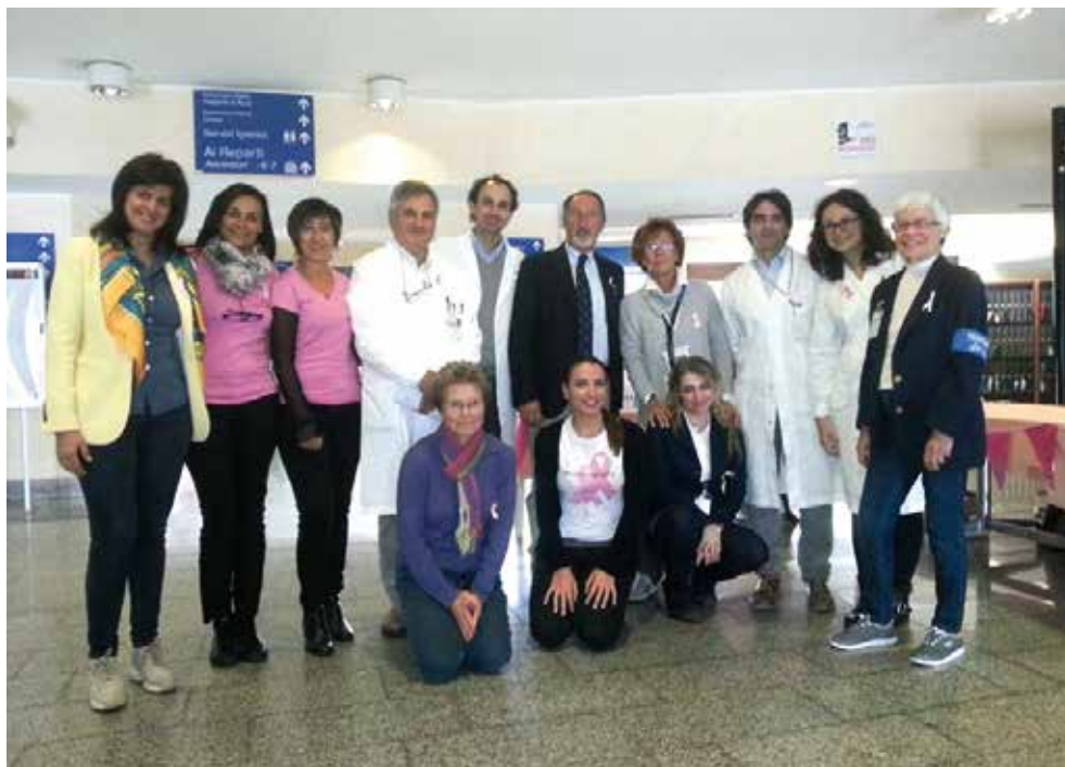
I medici ed i volontari delle visite in ospedale

Con lui vanno ringraziati tutti i medici che di volta in volta si alternano nelle giornate di visita in piazza, che con passione e altruismo accettano di aiutare i cittadini a trovare con semplicità ed immediatezza una risposta alla loro esigenza di prevenzione.