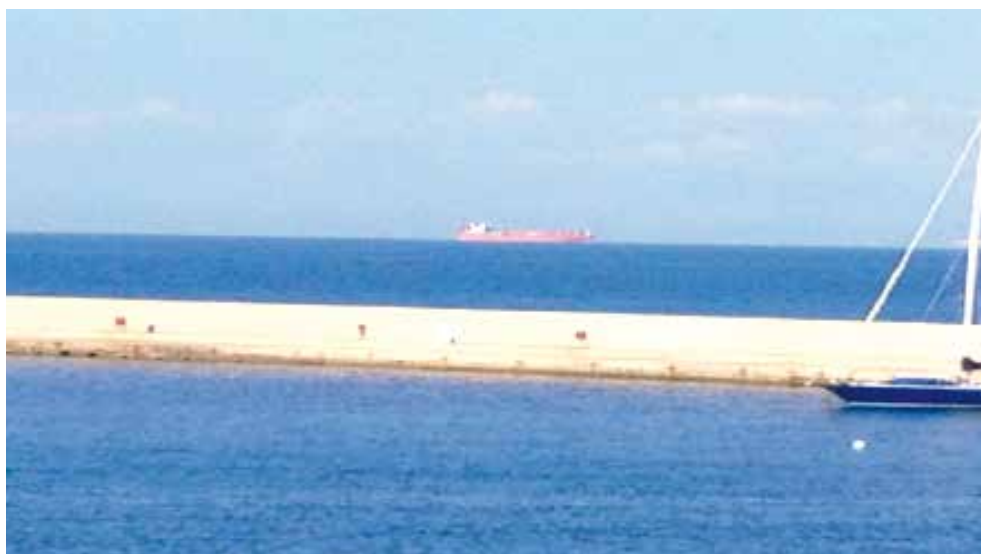
La Nave Rosa di Ventotene che ha ispirato il "Manifesto Rosa" della LILT di Latina

La LILT di Latina, anche con la collaborazione dell'Associazione Italiana Medici per l'Ambiente, ha intenzione di ampliare, nel prossimo futuro, l'offerta informativa con maggiori approfondimenti riguardanti i rapporti tra l'alimentazione, la sicurezza alimentare, l'inquinamento (aria, acqua, suolo) e la nostra salute perché come affermava Albert Einstein: "l'uomo intelligente risolve spesso i problemi difficili, l'uomo veramente saggio evita di crearli".