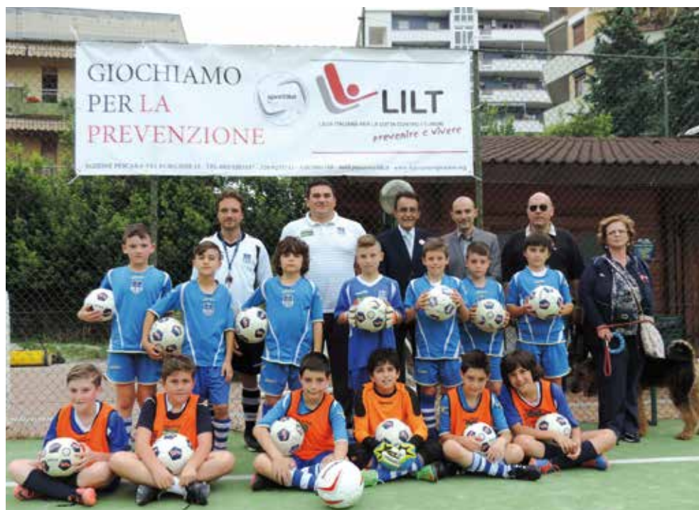
Gemellaggio NAIADI-LILT: partite di calcio con piccoli amici