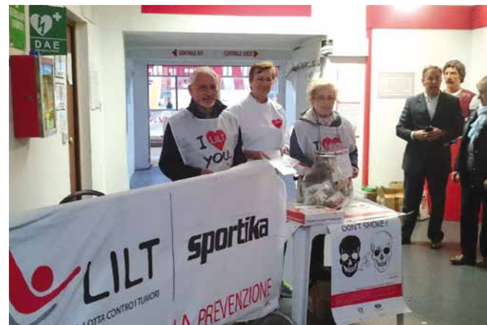
Volontari LILT Rimini allo stadio "Romeo Neri" per GMST

Il modus operandi è la presentazione dell'argomento ai ragazzi più grandi (IV e V superiore) che con laboratori e incontri con le nostre esperte hanno ideato uno strumento innovativo per portare l'argomento ai ragazzi del biennio della stessa scuola. Hanno aderito al progetto 4 Istituti Superiori di Rimini (ITIG, Liceo Scientifico, Maestre Pie e Liceo Socio Economico) per un totale di 400 ragazzi e 12 insegnanti.