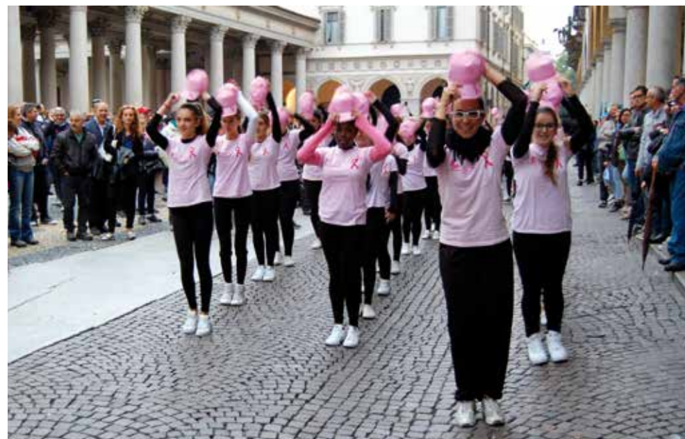
Flash Mob. L'esercito in rosa nel centro storico di Novara.

Martedì 24 marzo in collaborazione con la Sezione Soci Coop di Novara e con il sostegno dell'Azienda Ospedaliero Universitaria Maggiore della Carità di Novara è stata proposta una conferenza dal titolo "Il piacere della salute: ... dalla tavola ... alla palestra", un momento di confronto e riflessione al quale sono intervenuti la Presidente Lilt, il Direttore S.C.D.O. Dietetica e Nutrizione Clinica e il Direttore S.C.D.U. Fisiatria. A questo primo incontro sono seguite le lezioni del corso di cucina a tema tenute dallo chef della Scuola Alberghiera novarese e con l'intervento