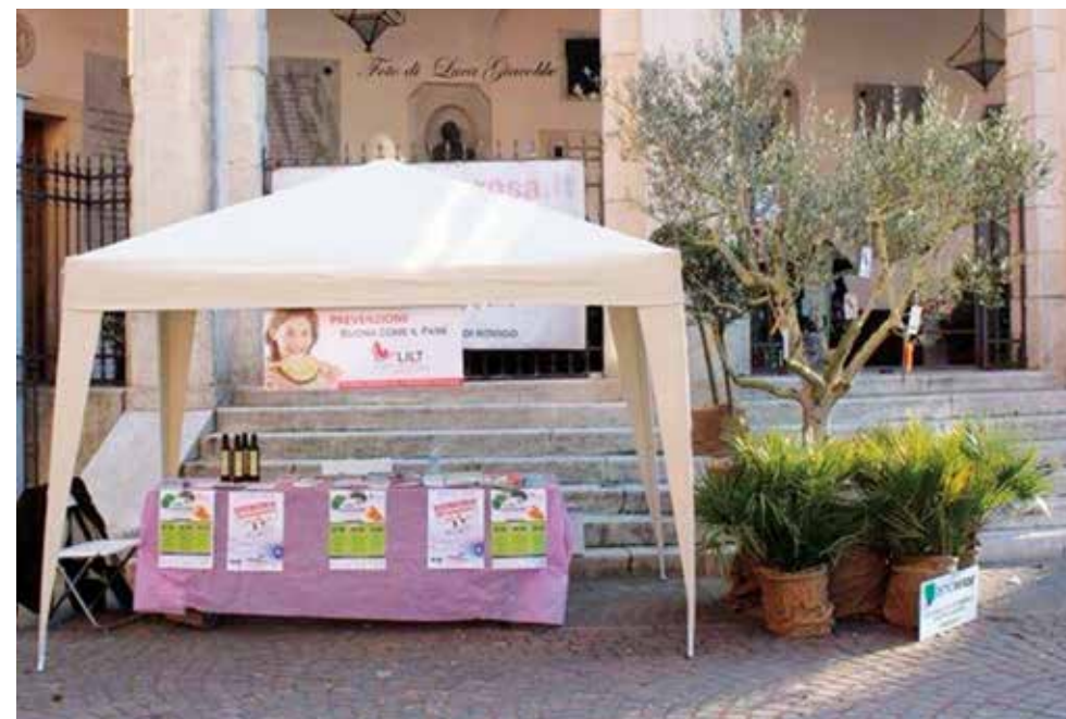
Stand per la Settimana Nazionale per la Prevenzione Oncologica