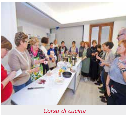
Corso di cucina

attrezzato ad ambulatorio mobile, dotato anche di ecografo, ha accolto moltissime donne, in modo particolare quelle non inserite nei programmi di screening del Servizio sanitario nazionale.