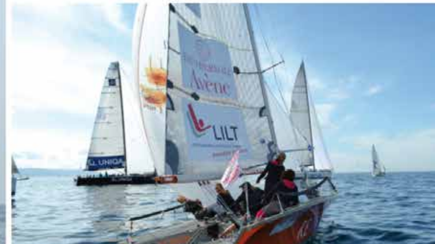
l'equipaggio delle Stelle Olimpiche