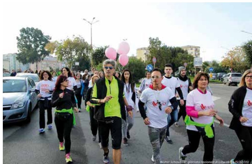
LILT Crotona, attività sportiva all'aria aperta