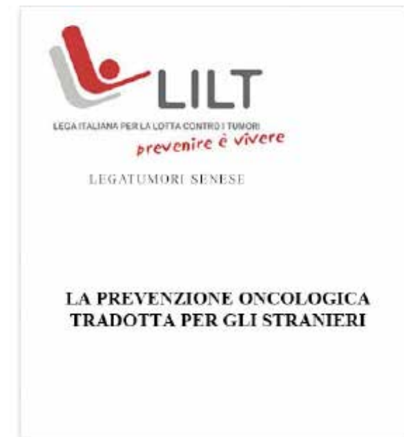
Prontuario di educazione alla salute tradotto in diverse lingue