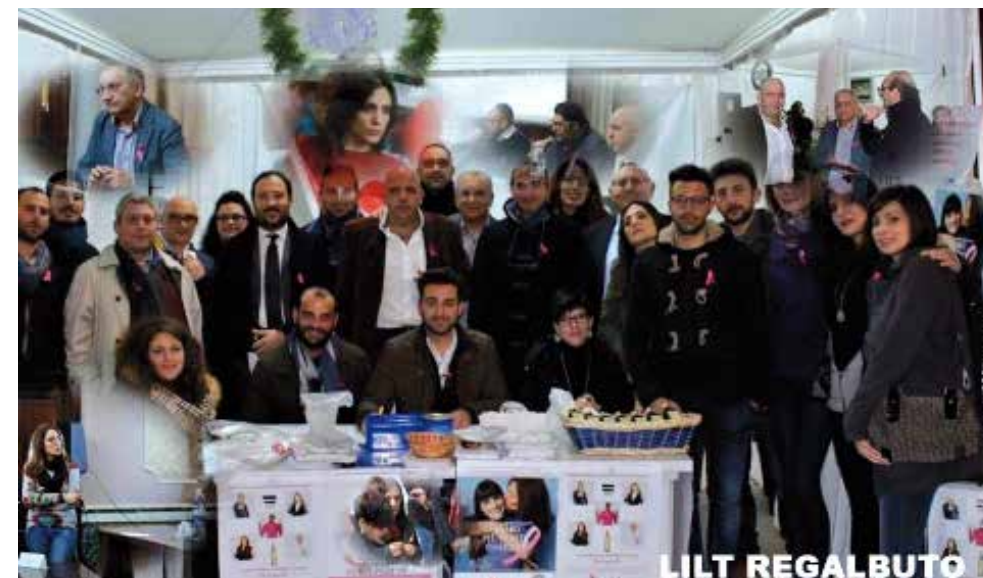
LILT di Enna a Regalbuto in occasione della Settimana Nazionale per la Prevenzione Oncologica 2015