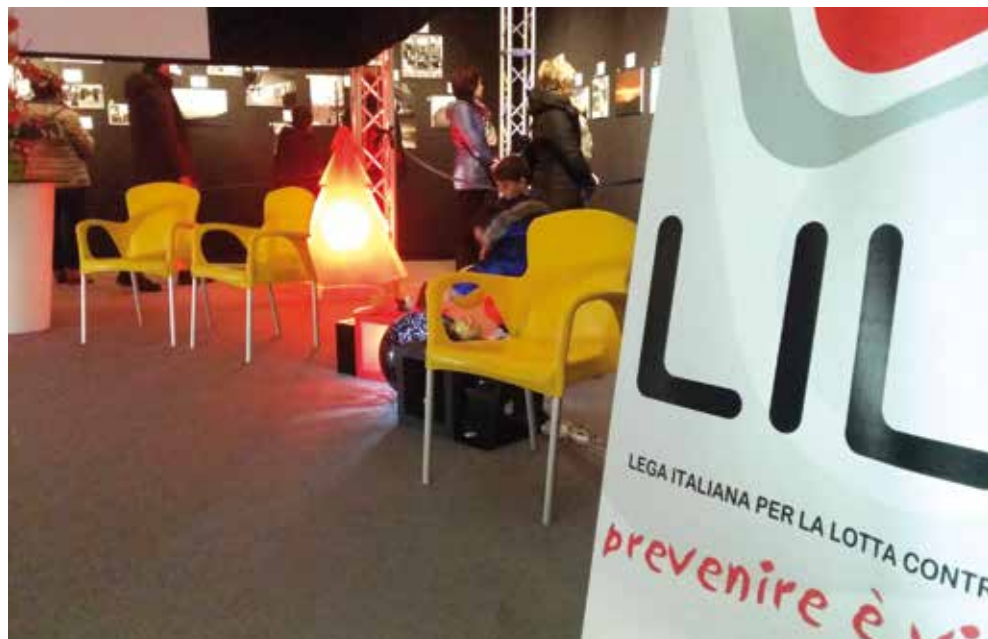
LILT Caltanissetta alla manifestazione "Piazza a colori"