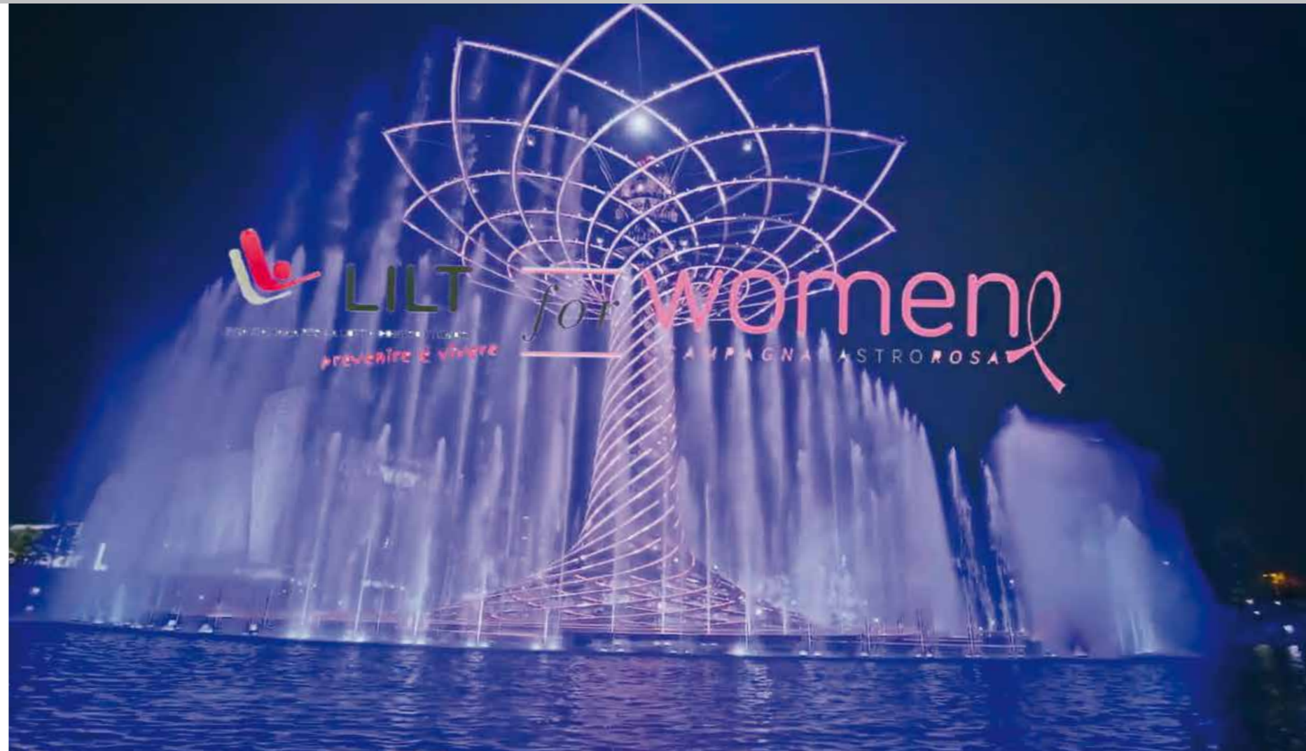
Expo - L'Albero della Vita illuminato in occasione della Campagna "LILT for Women - Nastro Rosa"