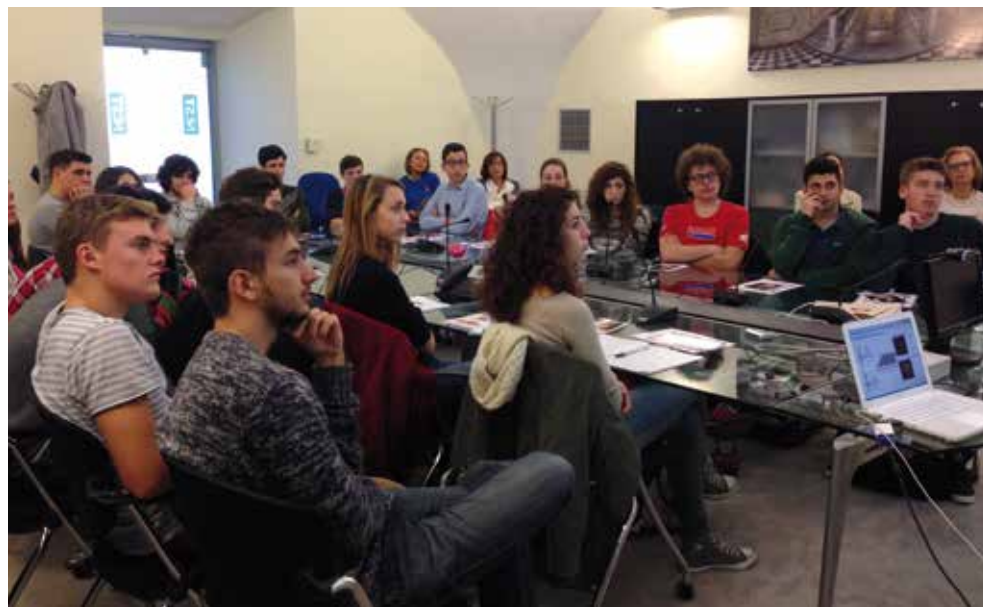
Studenti delle scuole superiori pisane alla conferenza del NEST

18 dicembre 2015- La LILT viene invitata al "Brindisi degli auguri Natalizi" presso la Ditta NTT DATA di Pisa con la vendita di stelle di natale. Ricordiamo inoltre che