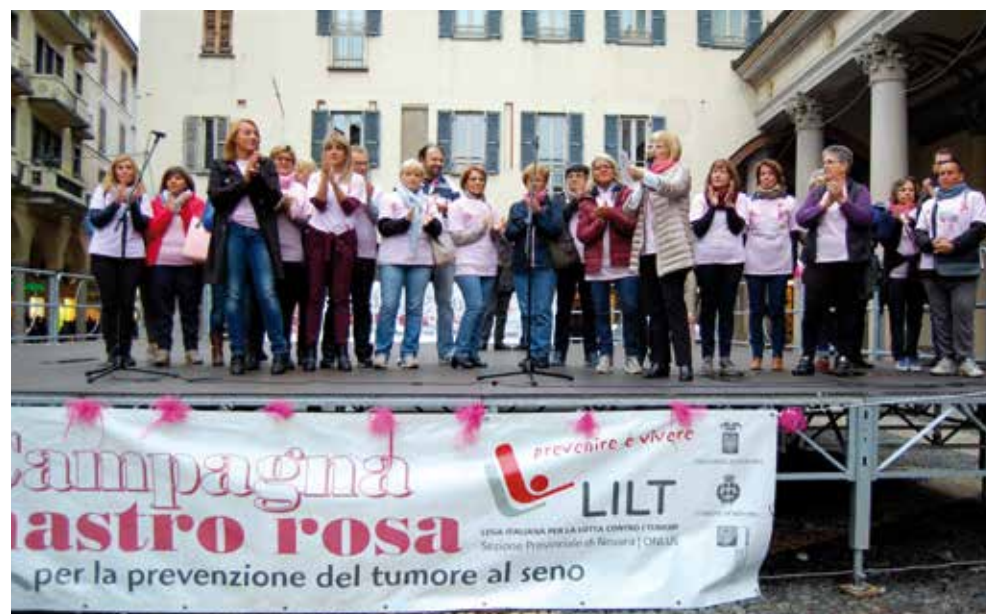
Presentazione della Campagna "Nastro Rosa" 2015

Progetto Follow up e stili di vita per pazienti con tumore della mammella e del colon retto. Nell'ambito del "Progetto Follow up e stili di vita per pazienti con tumore della mammella e del colon retto" promosso dalla Rete Oncologica del Piemonte e della