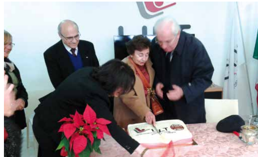
Natale in LILT Avellino

Inoltre il 2015 è stato caratterizzato, come negli anni precedenti, dal potenziamento del Poliambulatorio LILT. Sono stati acquistati: 1) un apparecchio radiologico digitale, in sostituzione del vecchio apparecchio analogico, presente nella nostra struttura sanitaria sin dalla sua istituzione; 2) un videolaringoscopio che utilizza la tecnica NBI, questo endoscopio è unico nella nostra provincia ed è uno dei pochi presenti nelle strutture sanitarie della Regione Campania; 3) un apparecchio per prove urodinamiche e per uroflussometria indispensabile per la diagnosi delle sindromi ostruttive urinarie e per la diagnosi dei disturbi urinari conseguenti a interventi urologici, ginecologici e a terapia radiante, in modo da poter programmare il trattamento riabilitativo; 4) apparecchi per prove vestibolari per completare la diagnostica ORL. Accanto al potenziamento delle apparecchiature