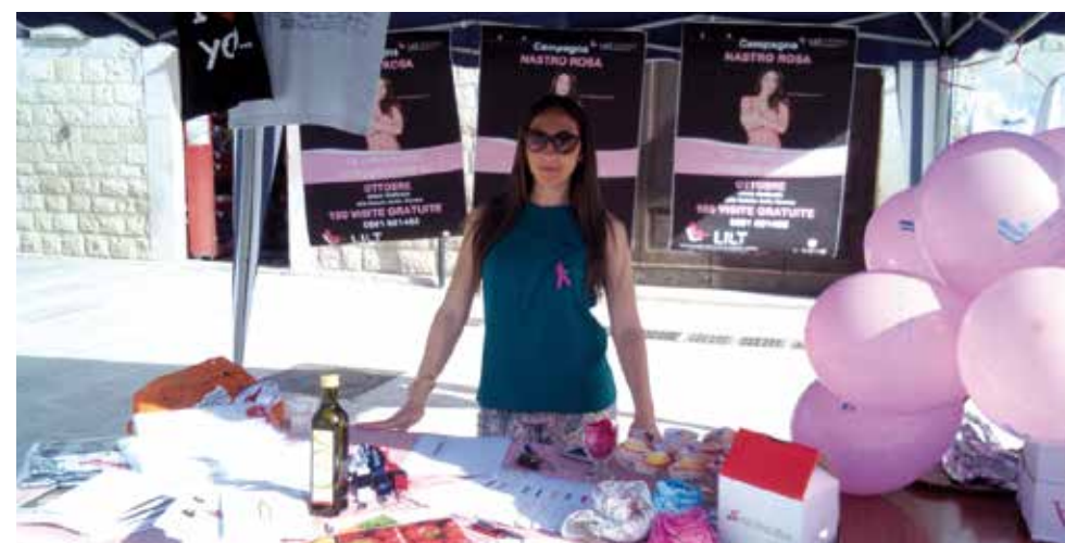
LILT Foggia a Zapponeta

La LILT di Foggia e l'Azienda Ospedaliera Universitaria Dipartimento di Oncologia si sono occupate del primo livello: decisione di cambiamento. La LILT di Foggia e il Dipartimento di Prevenzione si sono occupate di strutturare una serie di attività di secondo livello: per lavorare sul cambiamento.