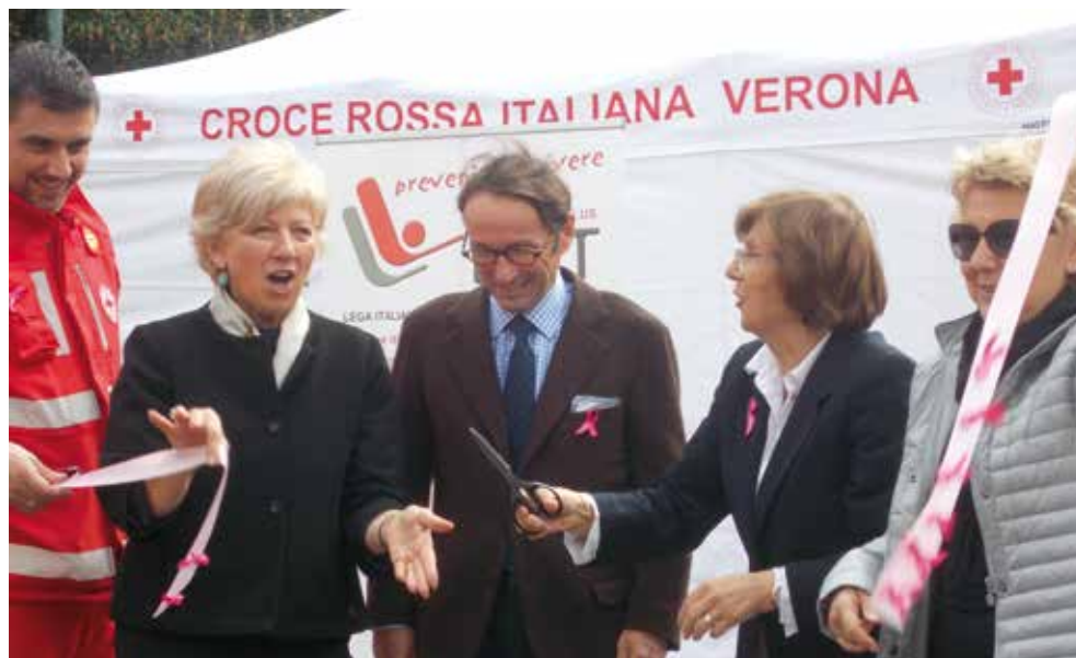
Manifestazione Nastro Rosa 2015